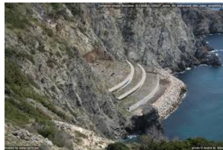
Usine de traitement des eaux Amphitria, cap Sicié, ouvert en 1997

Quelques observations sur la transformation des littoraux seynois, introduction au colloque de novembre 2024 (mai 2024)