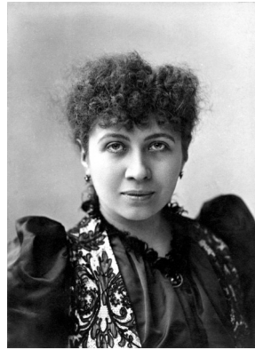
Caroline Rémy dit Séverine