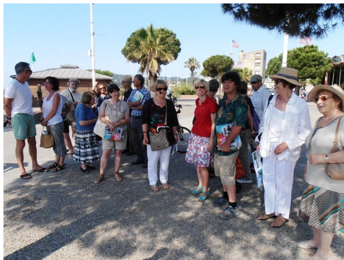
Inauguration du parcours découverte, le 7 juillet 2013

Pour ce village de la reconstruction d'après-guerre, l'architecte Pouillon aménage un espace urbain complet : habitations, commerce, hôtel, pension, places, avec des passages couverts et des ouvertures sur la mer, fermées aujourd'hui pour certaines d'entre elles. De style méditerranéen avec ses arcades, ses balcons en bois, son décor en briques, ses ouvertures en claustras, le village a bénéficié des interventions des amis de l'artiste : naïade d'Arnaud, céramiques de Sourdive, « cocotte » d'Amado, entre autres.