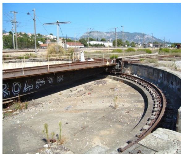
Le pont tournant de la gare SNCF à La Seyne