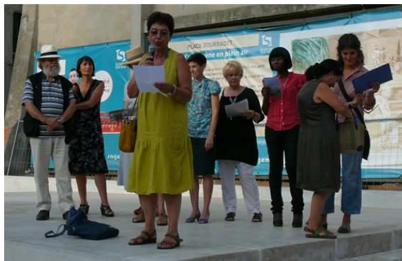
Inauguration de l'exposition le 9 septembre 2011

tous ces travailleurs du Foyer API qui ont vécu et vieilli dans un provisoire qui a duré, loin de leurs familles. Un meuble à tiroirs-vitrines, un rayonnage avec livres redonnent vie à l'association des travailleurs noirs en présentant une partie de leurs archives. La deuxième génération, celle des enfants qui ont grandi à La Seyne, a aussi témoigné : sur des tiges-tours on peut lire et voir ce qui a fait leur vie avant et après les chantiers navals. Toute la diversité est là, bien visible mais aussi audible, grâce aux casques d'écoute des montages sonores racontant de façon émouvante, la vie seynoise de 1945 à nos jours.