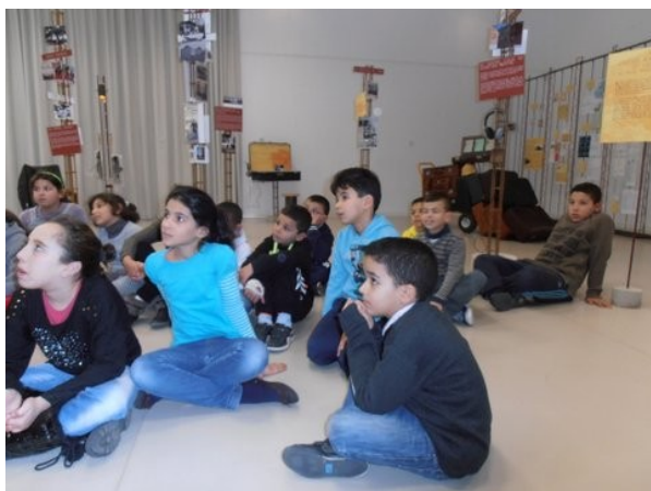
Des enfants attentifs

Après les visites, les moments d'échanges ont été pré-