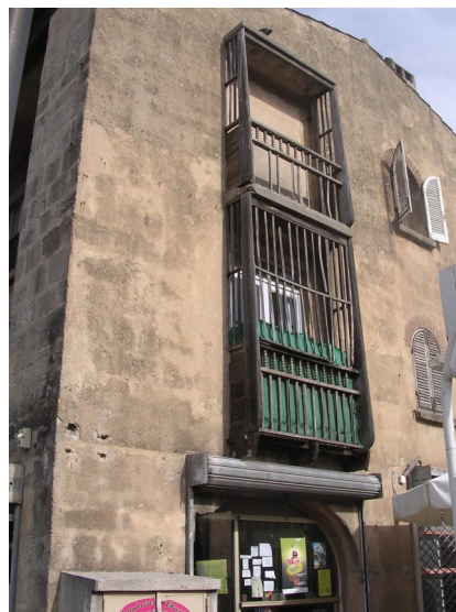
Balcon en bois de la maison carrée

Aujourd'hui peu de Seynois et surtout de non Seynois savent qu'ils ont à portée de main une œuvre architecturale originale et exceptionnelle de Fernand Pouillon. Au cours des décennies passées les habitants du village, parfois, ont oublié la qualité de l'espace dans lequel ils travaillaient et ils vivaient.