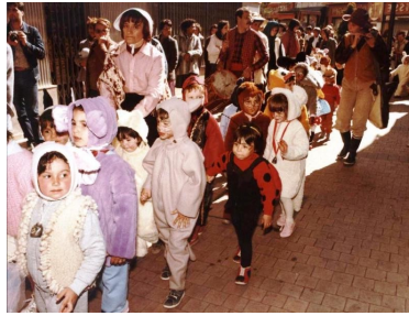
Carnaval frondeur 1973

L'exposition « Un petit paradis », Maison du patrimoine