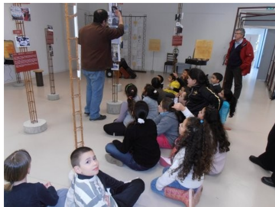
Une classe de l'école Lucie Aubrac

2 cédés d'une écoute collective d'un témoignage d'un ancien des chantiers, d'origine italienne qui racontait son arrivée enfant à La Seyne à la fin des années 1950. L'identification et la distance ont été bénéfiques pour ce jeune public : il avait là un enfant qui leur ressemblait mais dans un contexte tellement différent qu'ils en venaient à prendre conscience du changement lié à l'Histoire.