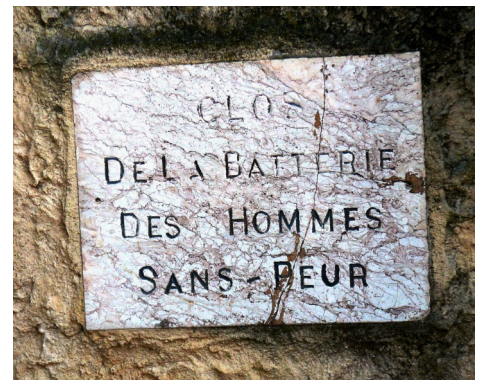
Plaque apposée à proximité du lieu de la batterie des hommes sans peur